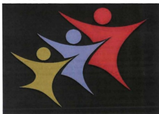
Ayuntamiento de Berantevilla

Desde el Departamento de Euskera de la Cuadrilla de Añana se promueve un cursillo de "Euskera" a dos niveles: uno para iniciados y otro para avanzados.